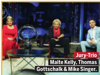
Jury-Trio Maite Kelly, Thomas Gottschalk & Mike Singer.