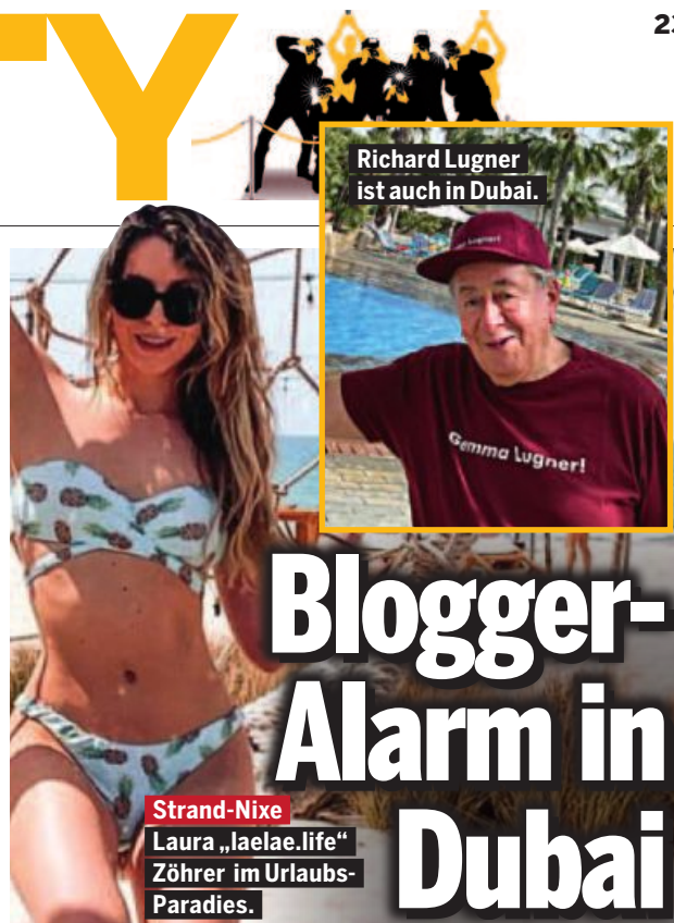
Richard Lugner ist auch in Dubai.