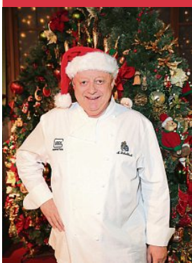
Alfons Schuhbeck kochte vegetarisch