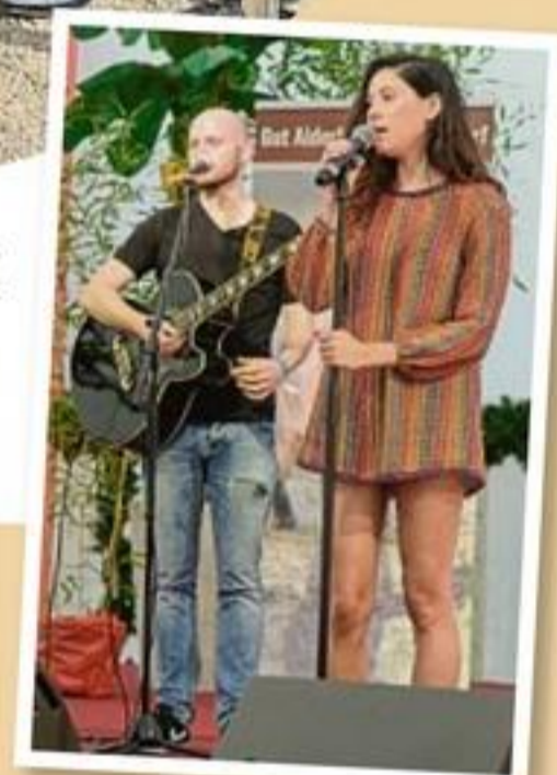
Eliza Doolittle kam für nur wenige Stunden aus London

zonen und Kakadus, deren Besitzer verstorben sind. Trotzdem man Kathrin Glock warnt, dass Kakadus gefährlich sein können, geht sie in die große Voliere. Ganz brav schmiegen sie sich an ihre Gönnerin, als ob sie ahnen könnten, dass es auch ihr Verdienst ist, mit dem ihr neues Haus erst möglich wurde. Einige sprechen sogar. Ein Ara stellt fest: „Wieder wer do“ und der nächste frech: „Schlampel!“ Huch... Doch das löst nur großes Gelächter aus. Im